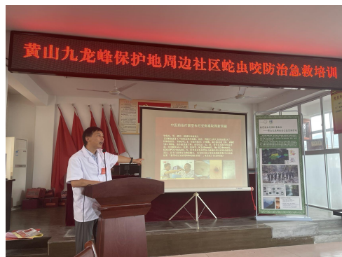
九龙峰保护区针对周边 11 个社区开展蛇伤急救培训发放蛇药 300 盒