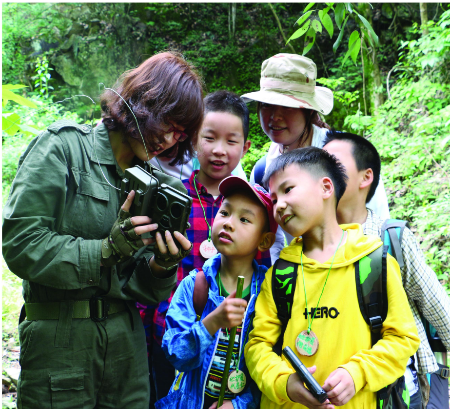
小小巡护员学习红外相机安装知识 九龙峰自然体验

4月17日，自然教育合作机构闻啼鸟带领的“神兽使者”亲子营来到九龙峰开展探秘保护区神兽的课程活动，活动内容包括：保护区纪录片观影，野外巡护及红外相机等，