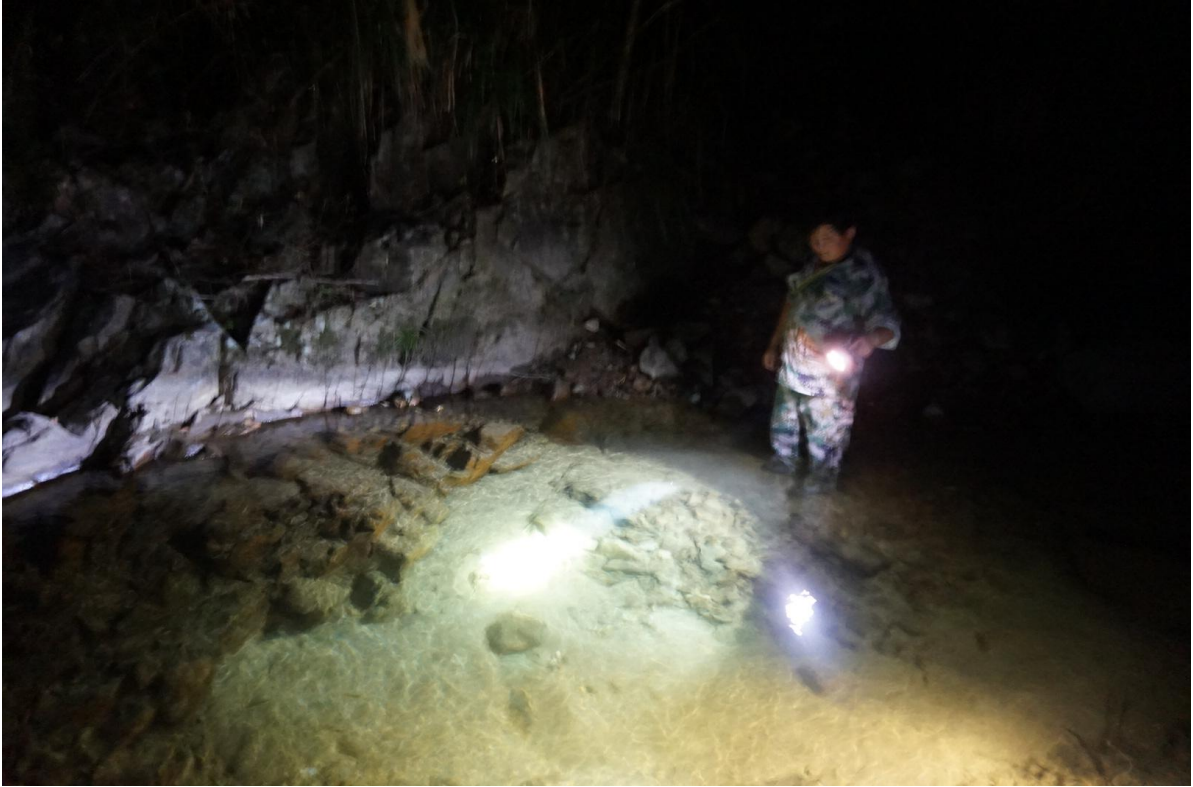
③ 排查非法进区入口，在关键入口处安装 4 台红外相机监控非法进区人员，其中青石坑处的监控相机拍摄非法进区人员 2 次。